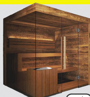
Tyrol Holz & Thermo Espe