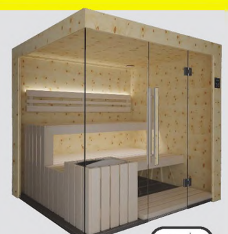
Zirbenholz & Espe hell