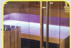
XL FLÄCHEN LIEGE