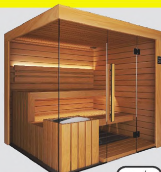
Thermo Espe komplett