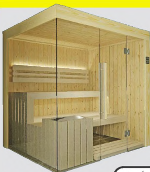
Nord. Fichte & Espe hell