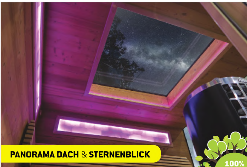
PANORAMA DACH & STERNENBLICK